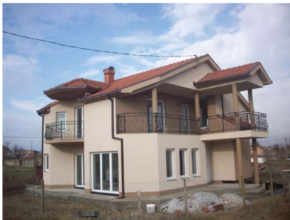
Објект Свети Николе Jubizol standard: ATZ 2.0mm (1131, 1133), KPT 1.8 mm 708, изведувач: Фиго Крстев- Свети Николе