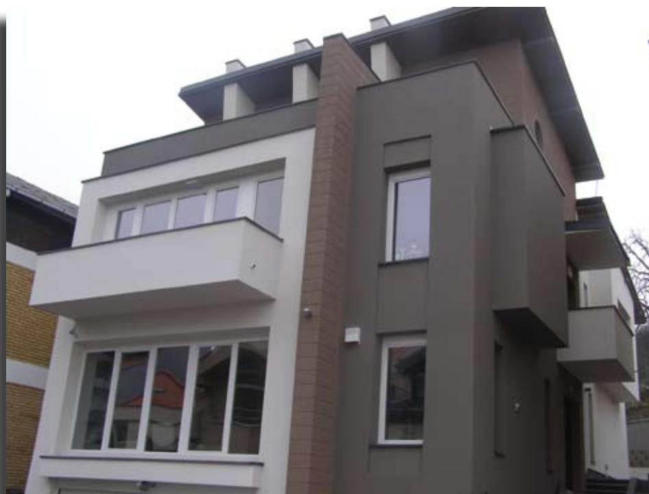
Објект нас.Трнодол Скопје Eps Lepilna Malta, ATG 1.5(1492), ATZ 2.0(1141), MAG1.5(1495), изведувач Гама Инженеринг-Вевечани

П реглед на референтни објекти изработени во минатиот период . И во овој број на JUB магазин прикажуваме референтни објекти каде правилно се вградени наши фасадни материјали.