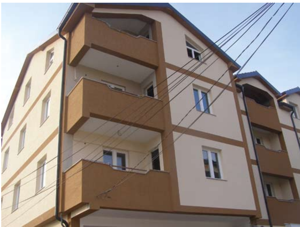
Објект нас. Чаир Скопје Jubizol стандард: ATZ 2.0 (1124) и (1131), KPT 2.0 (455) изведувач: Луки Фасаде Дизајн - Скопје