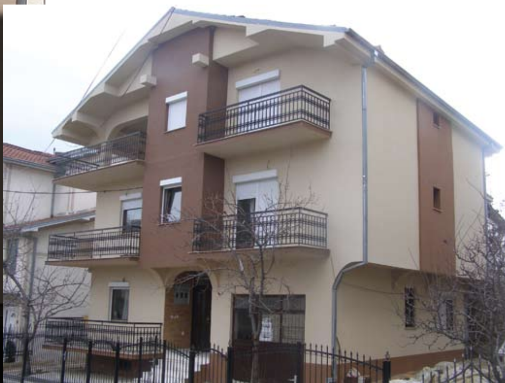
Објект Прилеп EPS LepilnaMalta, MAG 1.5m1094, KPT 445 изведувач: Оливер Јовески Прилеп