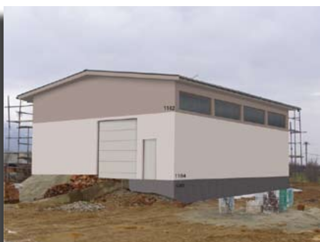
Предлог.1 цокла - Kulirplast 640 Нијанси: 1184,1182