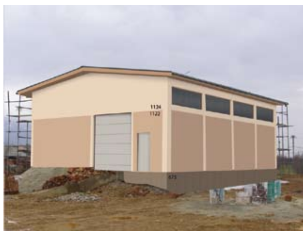
Предлог.2 цокла - Kulirplast 675 Нијанси: 1122,1124

Доколку сте во фаза на градење или реновирање на постоечки објекти, задовлство ќе ни биде ако се обратите до нас и нашата техничка служба во JUB дооел Скопје, на адреса: бул. Јане Сандански бр.79а-3, или на тел. број: 00389 2 24 54 027, како и на нашата е-маил адреса: jub@jub.com.mk