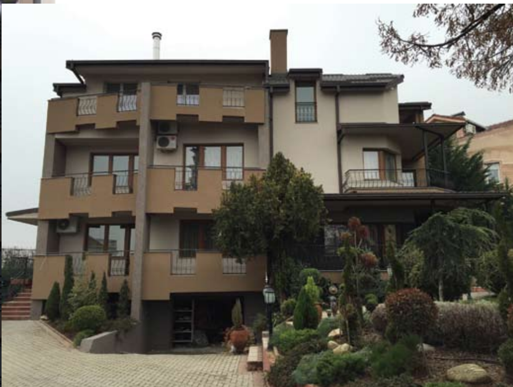
Објект нас. Пржино Скопје EPS Lep.Malta, ATG 1.5(1090), MAZ2.0(1443),KPT1.8(706), изведувач: Алекс Колор Скопје