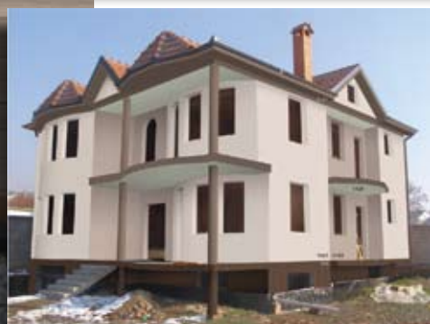
Предлог.1 цокла - Kulirplast 445 Нијанси: 1145,1143 и тераса 1424