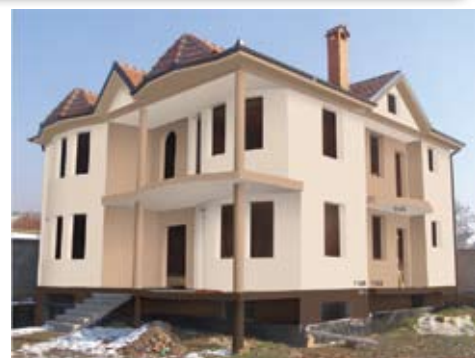
Предлог.2 цокла - Kulirplast 445 Нијанси: 1125,1122 и тераса 1125