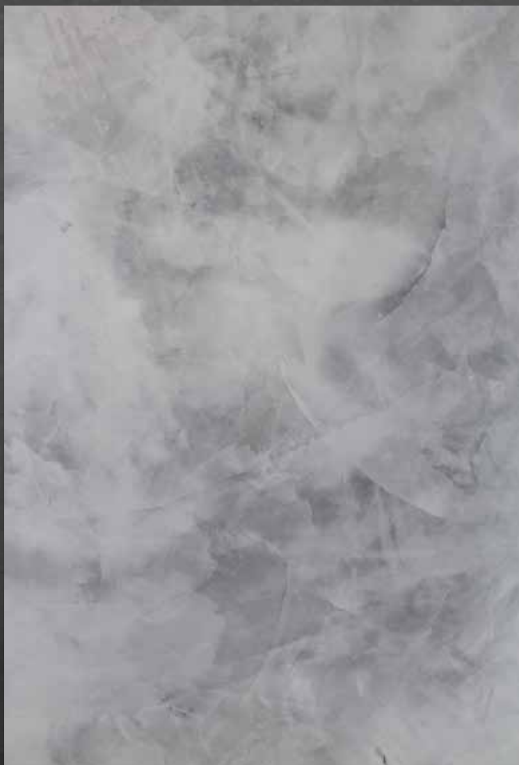
Marmorin odtenek 4641, Marmorin Shine