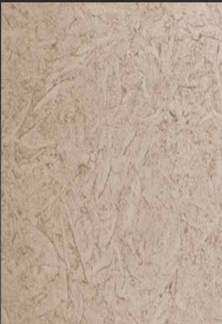
JUPOL Latex polmat 1134, Perla 1140