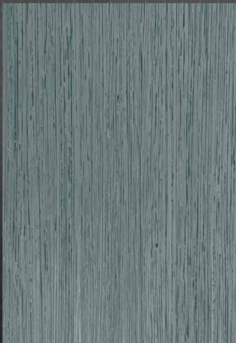
Marmorin odtenek 3420, Glamour odtenek 7503