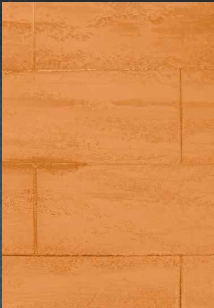
Marmorin odtенок 2152, Marmorin Shine