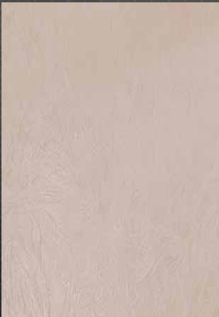
Marmorin odtenek 1255, Glamour odtenek 7301