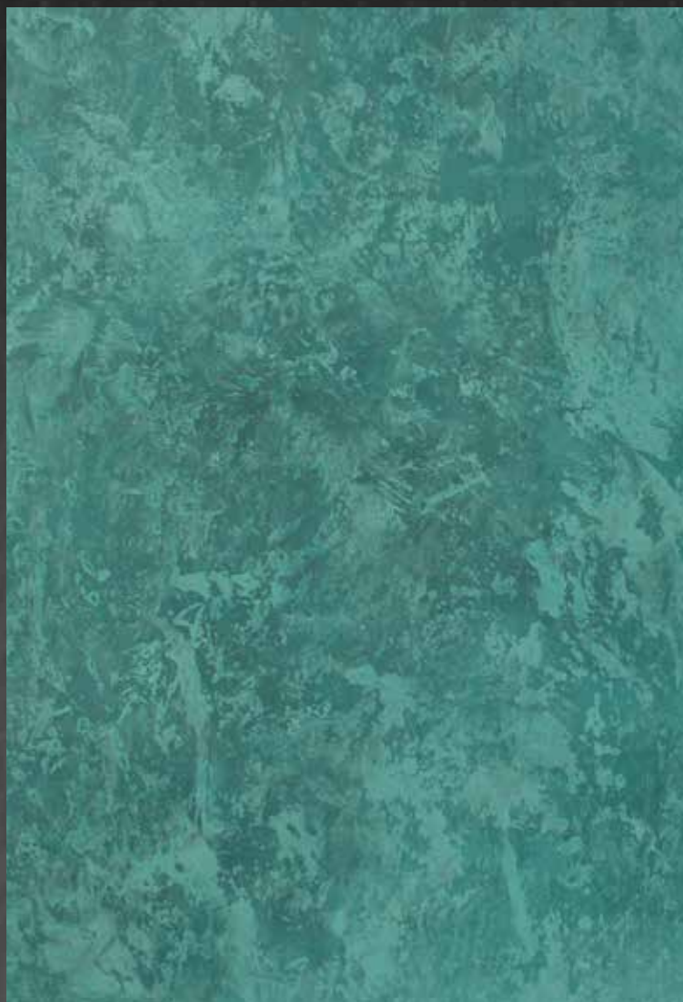
Marmorin odtenek 3420, Marmorin Shine