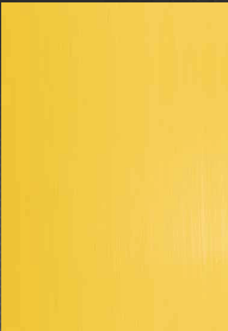
JUPOL Latex polmat odtenek 5520, Perla odtenek 3060