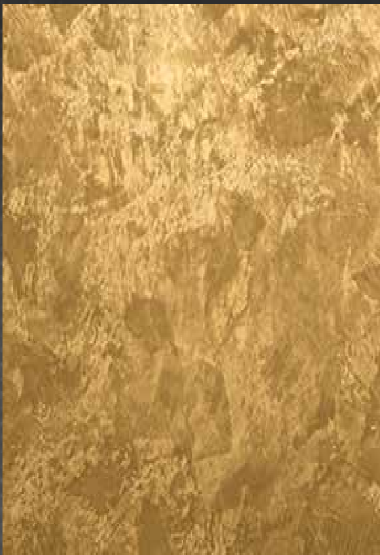
Marmorin odtenek 1072, Glamour odtenek 7001